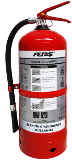
9 lt Köpüklü