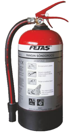
3 lt Köpüklü