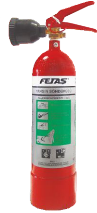
2 kg CO 2