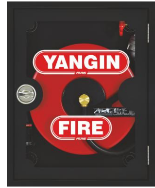
RAL 9005 - Cam kapak