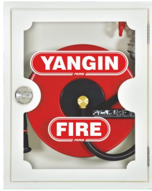
RAL 9010 - Cam kapak