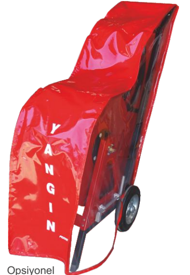
Opsiyonel Koruma Kılıfı